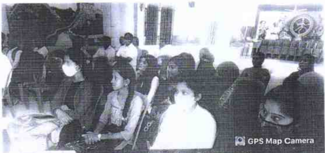
Faculty members present at the workshop on the second day.

Parli Vajinath, Maharashtra, India Navgan college road, RGRH+MGM, Habib Pura, Parli Vajinath, Maharashtra 431515, India Lat 18.841723° Long 76.528736° 24/01/23 11:04 AM GMT +05:30