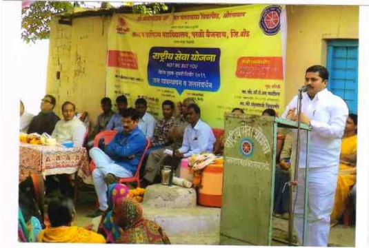
N.S.S. Residential camp organised at Nagpimpri from - 16 January to 22 January 2019 .