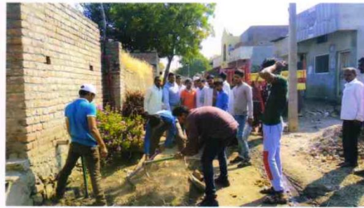
N.S.S. Volunteers cleaning the village, Nagpimpri .